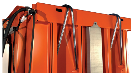
Rurki ułatwiające wiązanie beli