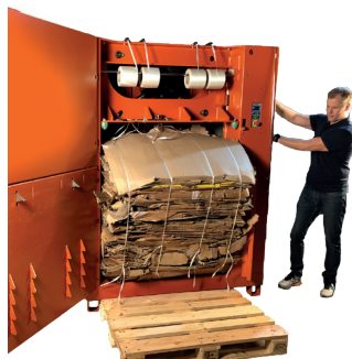
Wyrzut beli po naciśnięciu tylko dwóch przycisków!

ORWAK 3220 to szybka belownica, cykl pracy to tylko 16 sekund, zawsze w pełnej gotowości by przyjąć nowy załadunek makulatury lub folii. W standardowym wyposażeniu ma automatyczny start. ORWAK 3220 może być obsługiwana manualnie, jednak swoją maksymalną produktywność osiąga w trybie automatycznym.