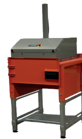
Wersja z pojedynczą komorą i drzwiami wahadłowymi