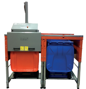
Wersja z podwójną komorą i klapą z dwoma uchwytami