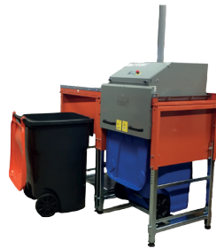
Przeznaczony do dwukołowych pojemników 360 l

ORWAK FLEX 4360 jest idealnym rozwiązaniem dla sektora hoteli i restauracji, gdzie odpady mieszane składowane są w pojemnikach na odpady. Nasze urządzenie zapewnia znaczną redukcję prasowanych odpadów, wpływając na oszczędność miejsca i zyskowność gospodarki odpadami.